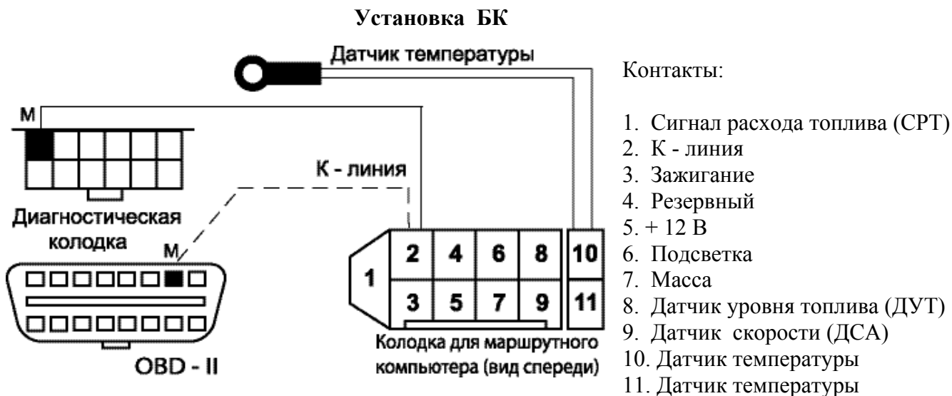
Рис.1 Подключение БК

Отсоедините отрицательную клемму от аккумулятора